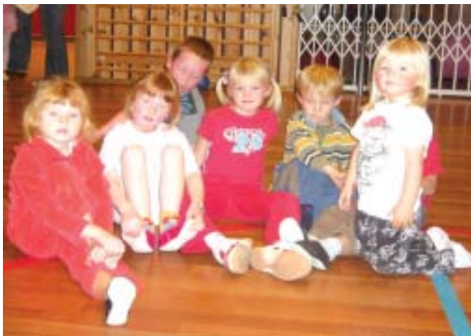
Alle trenger en pust i bakken innimellom!