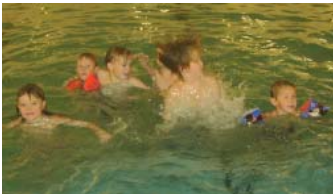
Basseng-kveldene er kjempepopulære!